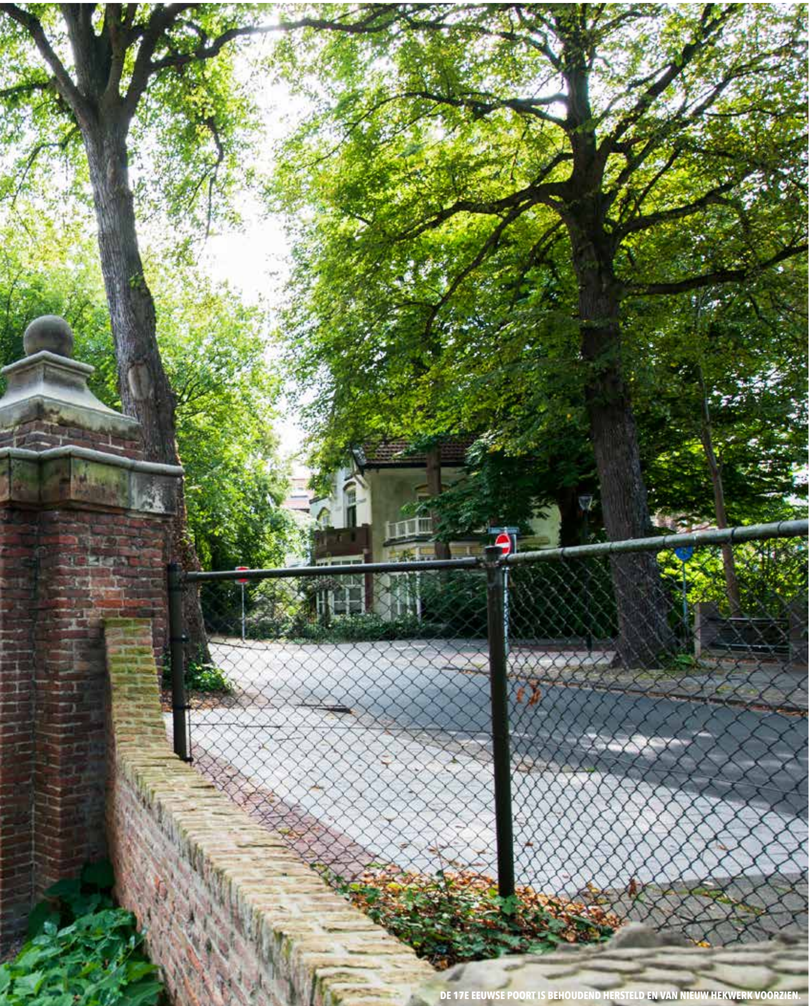
DE 17E EEUWSE POORT IS BEHOUDEND HERSTELD EN VAN NIEUW HEKWERK VOORZIEN.